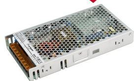
JTS-35-12-FA JTS-35-24-FA JTS-50-12-FA JTS-50-24-FA JTS-75-12-FA JTS-75-24-FA