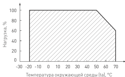
Рисунок 2. Максимальная допустимая нагрузка, % от мощности источника.