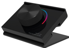
SMART-P100-RGB Black Арт. 031957