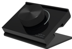
SMART-P100-DIM Black Арт. 029921