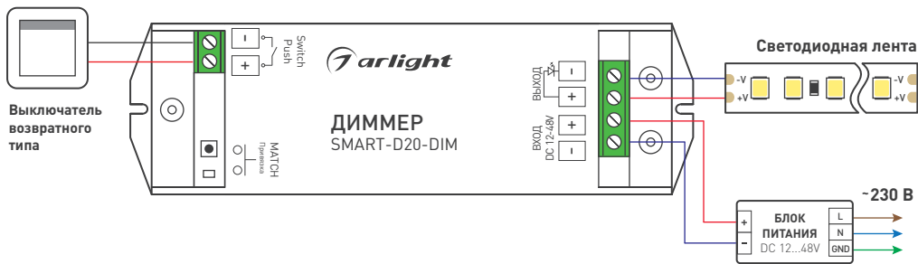
Рисунок 1. Схема подключения диммера SMART-D20-DIM